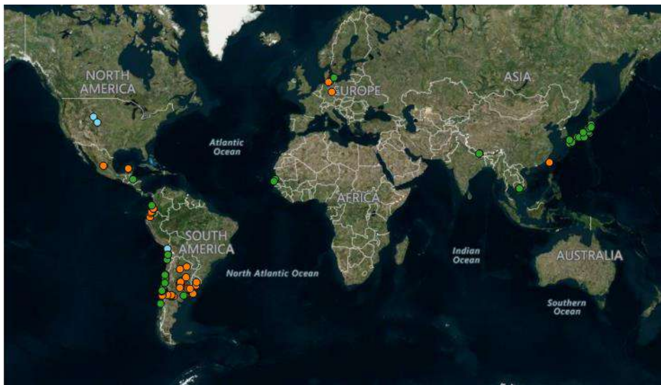
Зураг 2. 2023 оны 03-р сарын 01-16 ны хооронд шувуудын дунд бүртгэгдсэн шувууны томуугийн А хүрээний вирусийн тохиолдлын тархалт