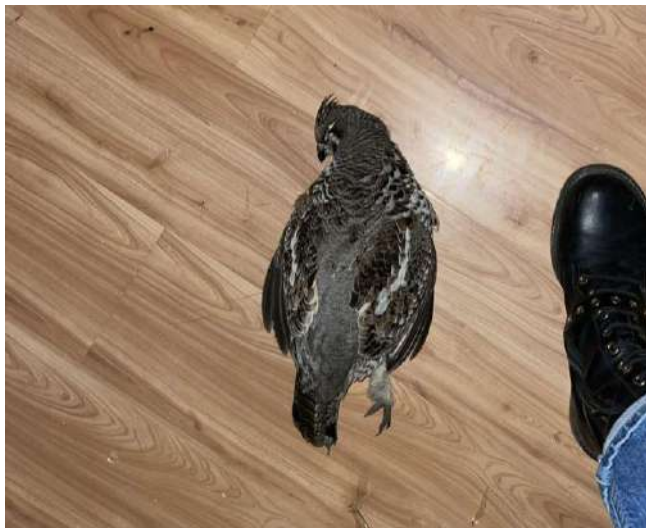
Зураг 1. Шивэр хөтүү

2023 оны 10 сарын 13 нд Сүхбаатар дүүргийн сэлбийн зусланд гэрийн цонхыг шувуу мөргөсөн гэж иргэн мэдэгдсэн. Шувууд шилэн барилга болон айлын цонхон дээр буусан модны тусгалыг андуурж мөргөж, үхэх тохиолдол бүртгэгдэх нь элбэг байдаг. Иймд цонхны гадна талыг савангаар зурах эсвэл цонхны дотор талаас зураг, дүрс наах зэргээр шувуудыг хамгаалах шаардлагатай.